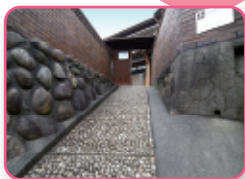
リニューアルが進む土管坂休憩所

やきもの散歩道散策はもとより、LOVETOKOの拠点とすべく、土管坂休憩所をリニューアルします。散策中の休憩だけでなく、様々なプロジェクトの発信基地として活用。空き家リノベーションの実例としてご覧いただけます。